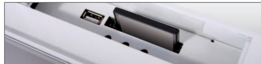
» Kartenschacht mit USB-Uploadsystem

Damit bleibt viel Platz für das Wesentliche: Ihre Werbebotschaft. Bild- und Videodateien lassen sich einfach via USB-Upload, CF- oder SD-Karte aufspielen. Für eine Wiedergabe vertonter Werbeinhalte sind die Lautsprecher bereits im Wall Frame integriert.