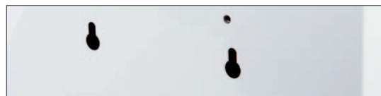
» Bajonettlöcher und Vesa Halterung